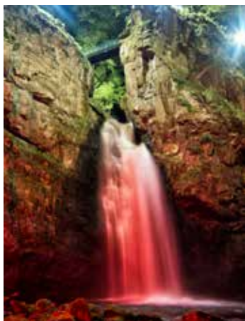
Wodospad Wilczki podświetlany, fot. J. Sobański