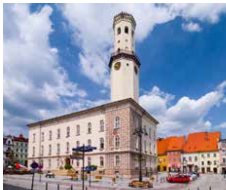
Ratusz w Bystrzycy Kłodzkiej