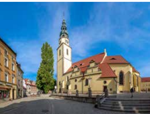
Kościół św. M. Archaniola