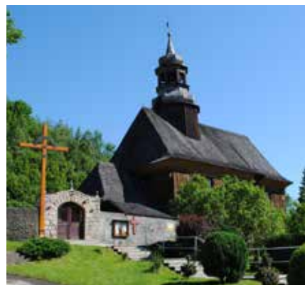
Drewniany kościółek w Nowej Bystrzycy