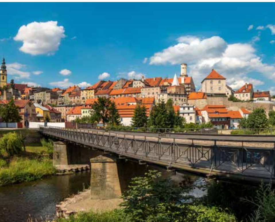
Bystrzyca Kłodzka most na Nysie Kłodzkiej

W czasie wizyty na ziemi kłodzkiej odwiedzenie Bystrzycy Kłodzkiej to „obowiązkowy punkt programu”. Mimo burzliwych dziejów, w czasie których miejscowość była wielokrotnie niszczona, zachowała ona średniowieczny układ urbanistyczny z gęstą zabudową, wąskimi uliczkami, Małym Rynkiem i murami obronnymi.