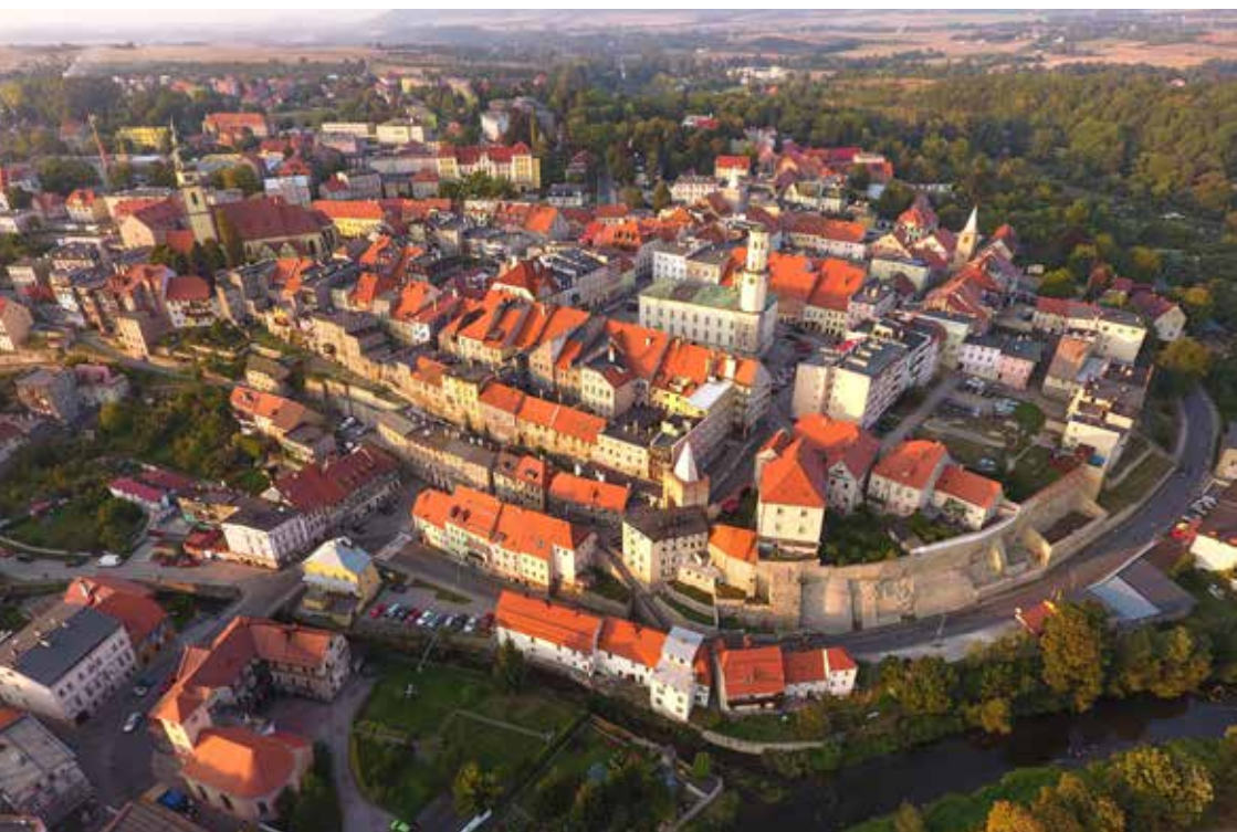
Bystrzyca Kłodzka z lotu ptaka