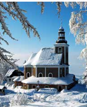
Sanktuarium Maria Śnieżna