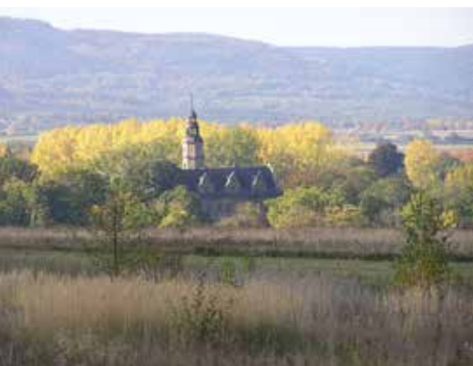
Zespół pałacowo-parkowy w Gorzanowie, fot. R. Duma

Wzniesiony jako kościół przedpogrzebowy na miejscu starszej kaplicy pochodzącej z 1631 r. Tworzy malowniczą, rozczłonkowaną bryłę z wydzielonym prezbiterium i kruchtami, wewnątrz możemy podziwiać barokowy ołtarz z około 1710 r.