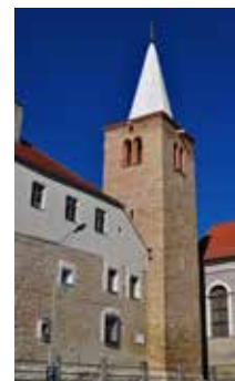
Baszta Rycerska

Z pocz. XIV w. zwana także Rzeźniczą, kamienna, z otworami strzelniczymi, hełmem ceglany (od 1608 r.) w formie ostrosłupa. W 1843 r. przerobiona na dzwonnice zbudowanego obok zboru ewangelickiego, w którym mieści się od roku 1964 r. Muzeum Filumenistyczne. Kapitałny remont Baszty Rycerskiej został przeprowadzony w latach 2012-2013 r.