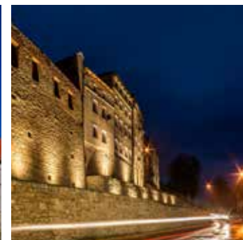
Mury obronne ul. Międzyłęsa, fot. J. Sobański