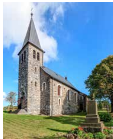
Kościół w Lasówce, fot. J. Sobański

XIX-wieczna, drewniana zabudowa pensjonatowa w stylu tyrolskim i norweskim.